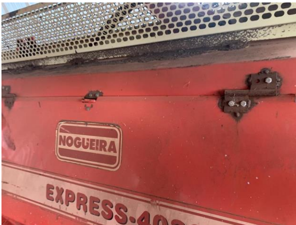
8.25. Foto 25