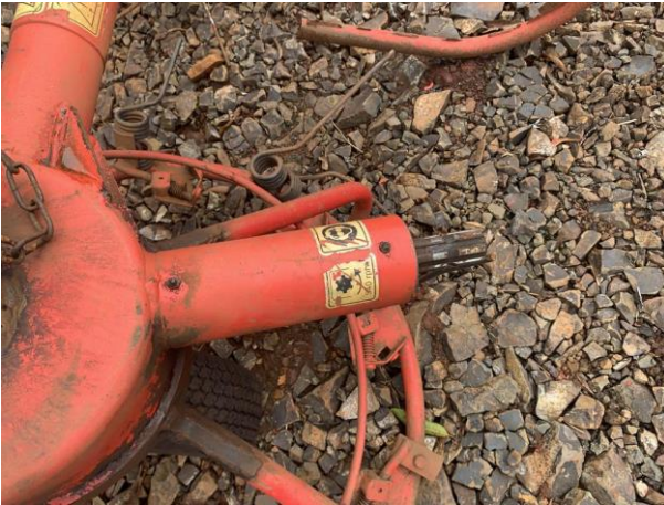
8.16. Foto 16