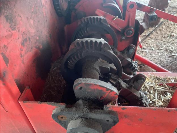
8.37. Foto 37