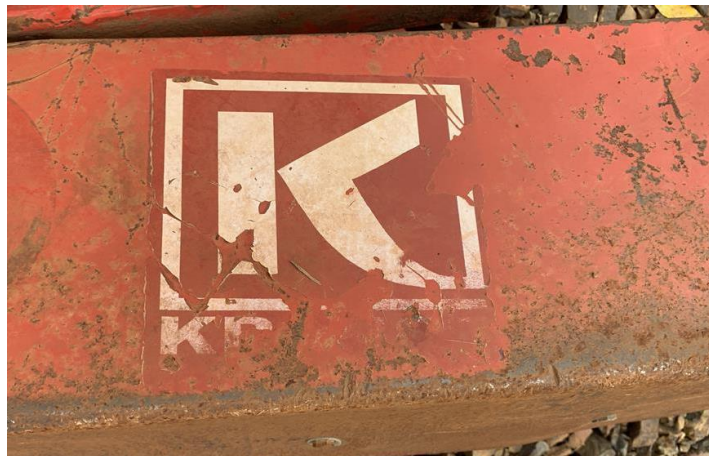
8.5. Foto 5