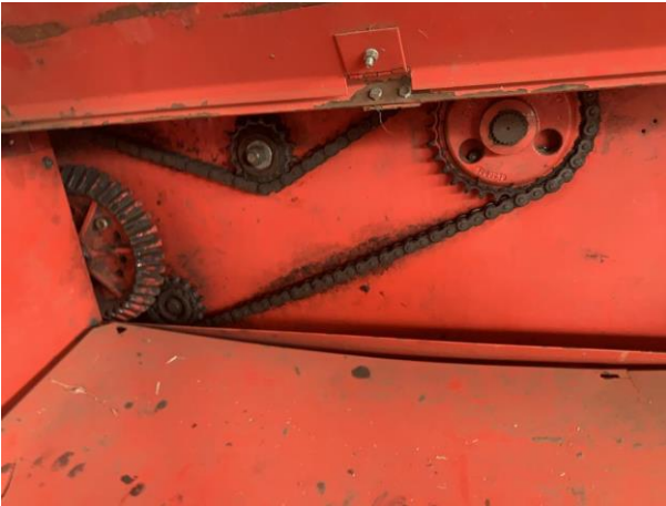
8.46. Foto 46