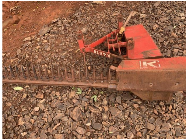
8.8. Foto 8