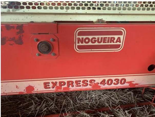
8.22. Foto 22