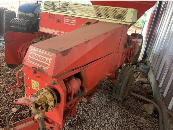
8.28. Foto 28