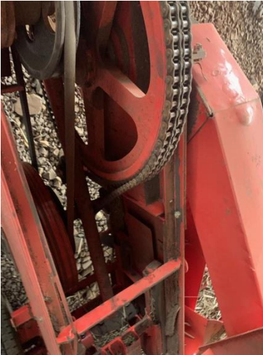
8.31. Foto 31