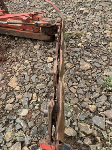
8.13. Foto 13