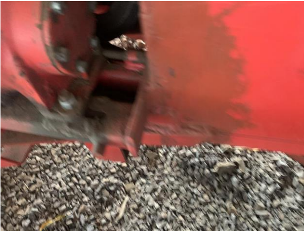
8.43. Foto 43