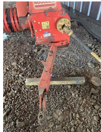
8.29. Foto 29