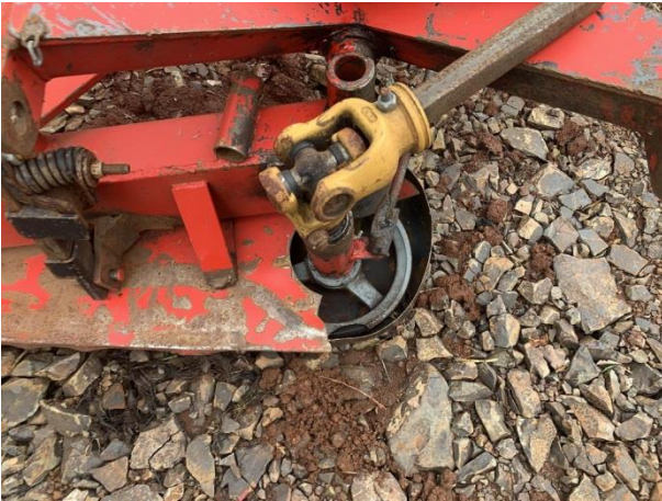
8.7. Foto 7