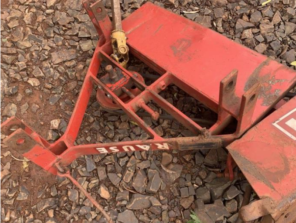
8.10. Foto 10