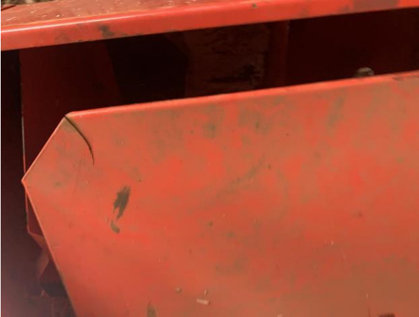
8.49. Foto 49