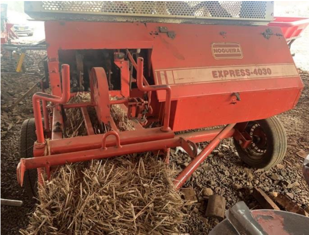
8.40. Foto 40