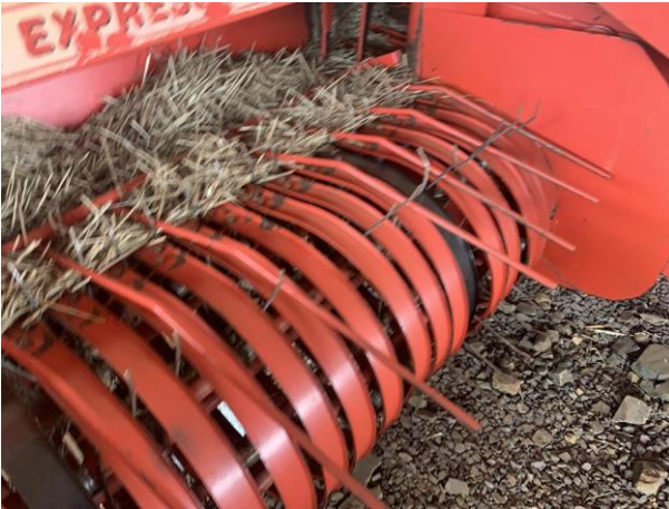
8.52. Foto 52