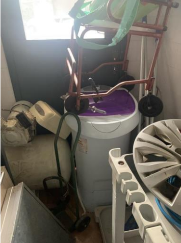
8.25. Foto 25