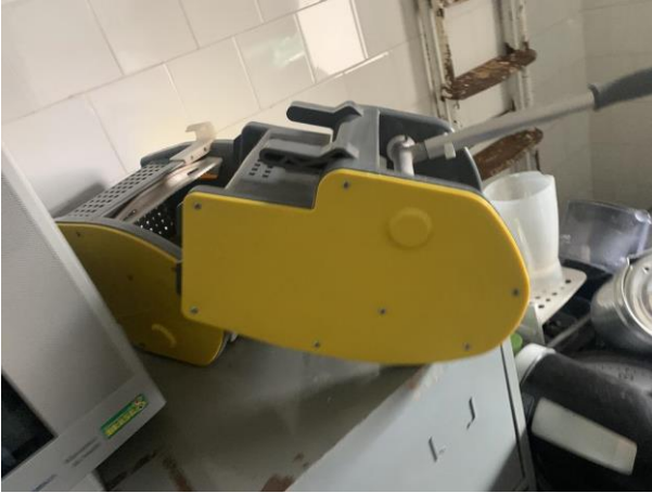
8.19. Foto 19