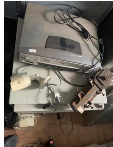
8.26. Foto 26