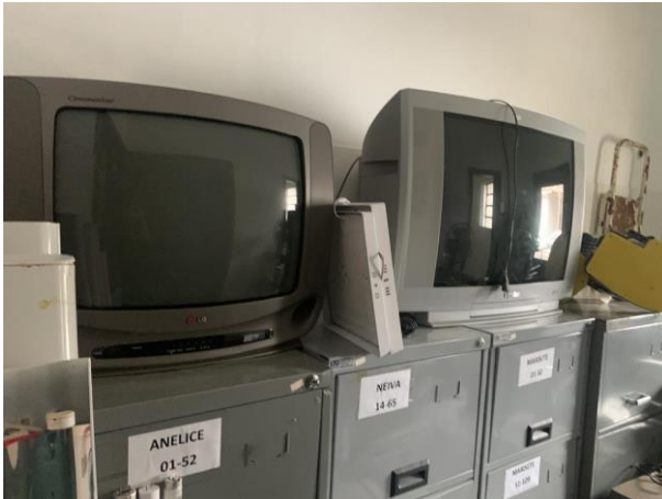
8.10. Foto 10