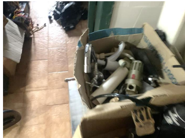
8.5. Foto 5