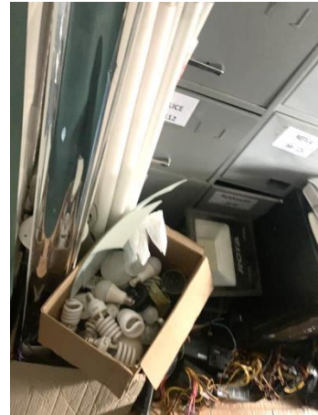
8.29. Foto 29