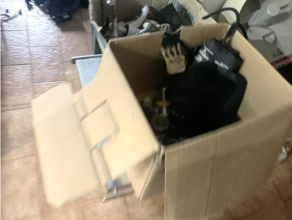
8.4. Foto 4