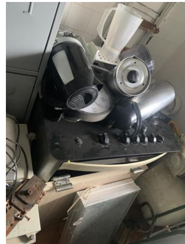
8.17. Foto 17