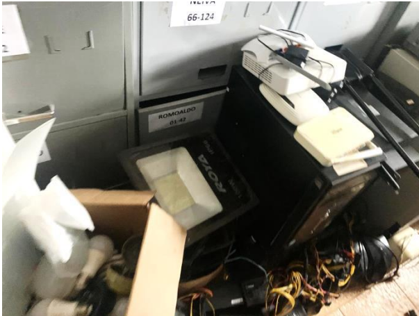
8.13. Foto 13