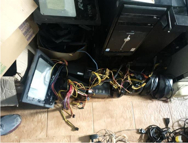
8.16. Foto 16