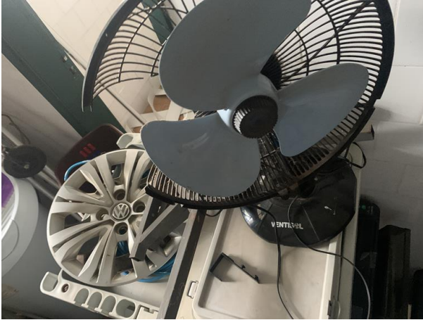
8.22. Foto 22