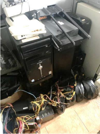
8.28. Foto 28