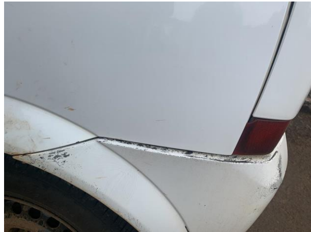
8.14. Foto 14