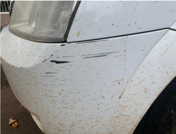
8.13. Foto 13