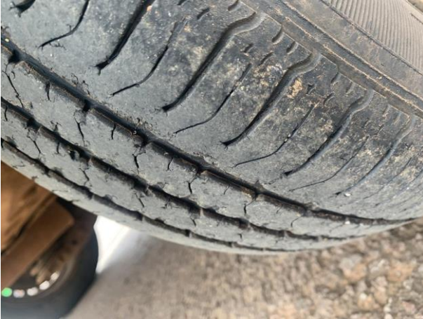
8.40. Foto 40