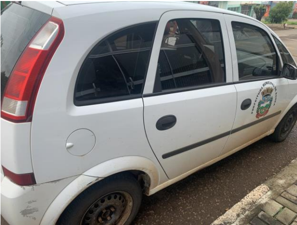
8.10. Foto 10