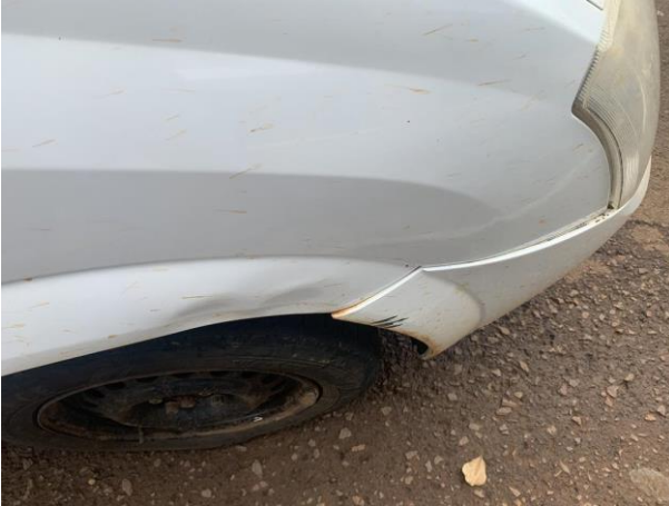
8.19. Foto 19