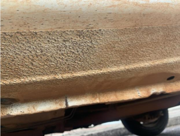
8.37. Foto 37