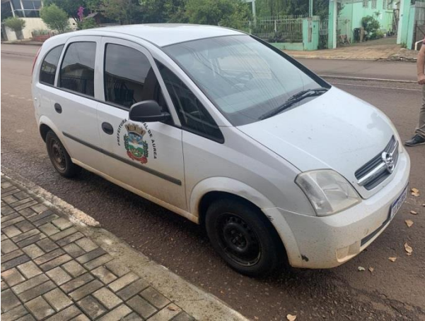
8.7. Foto 7