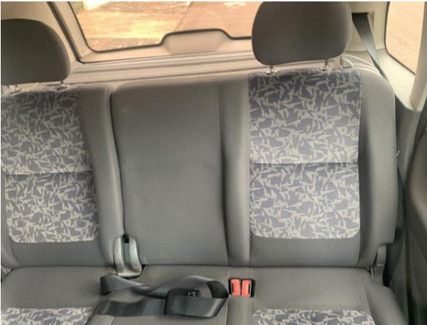
8.25. Foto 25