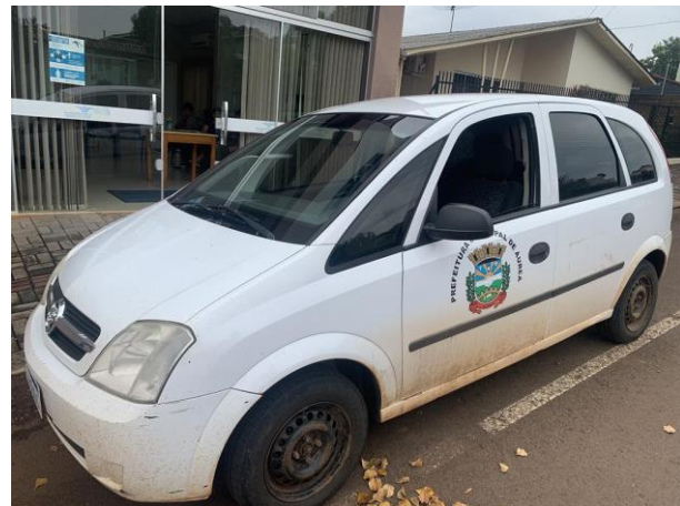
8.8. Foto 8