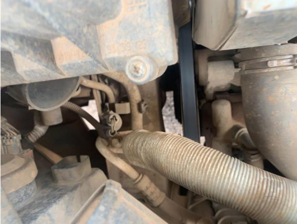
8.34. Foto 34