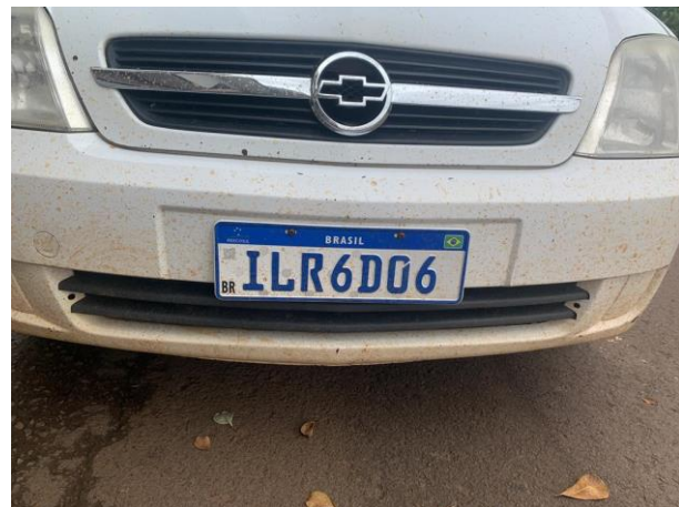
8.5. Foto 5