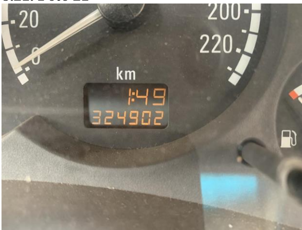
8.22. Foto 22