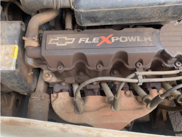
8.31. Foto 31