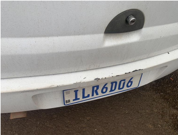
8.16. Foto 16